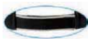
piping on back strap