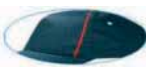
piping on front panel