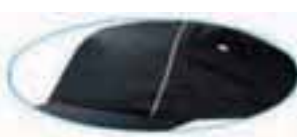
reflect piping on front panel