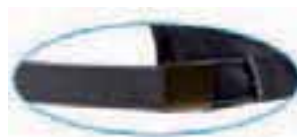
full brass buckle with sewn hole