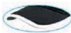
trim on visor