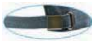
full brass buckle with metal hole