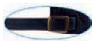
snap brass buckle with sewn hole