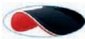
piping on visor