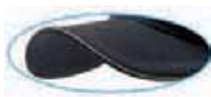
reflect piping on visor