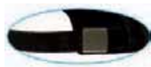
full silver buckle with sewn hole