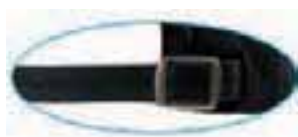
snap silver buckle with sewn hole