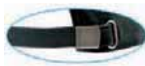
full silver buckle with metal hole