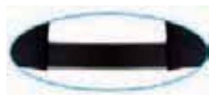
reflect piping on back strap